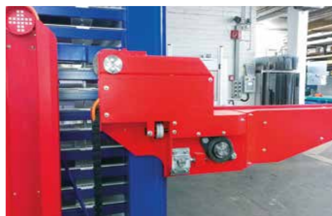
// fehr Multi Tower Typ Flach