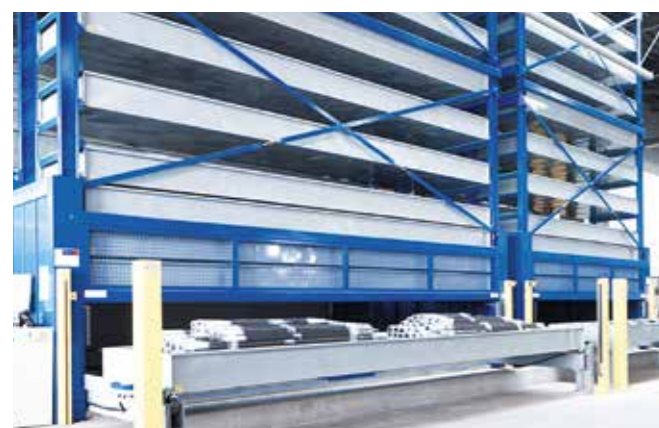
// fehr Multi Tower Typ Stab